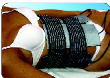
Detalle tratamiento automático abdominal Abdomen automatic treatment detail Détail du traitement automatique de l'abdomen