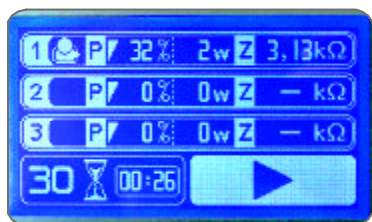
Detalle display NG CEYA SMART 3000 Display NG CEYA SMART 3000 detail Détail du display NG CEYA SMART 3000