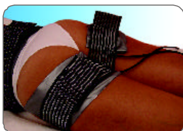
Detalle tratamiento automático glúteos Buttocks automatic treatment detail Détail du traitement automatique du fessier