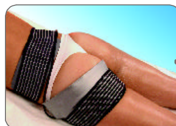
Detalle tratamiento combinado automático y manual Combined automatic and manual treatment detail Détail du traitement combiné automatique et manuel